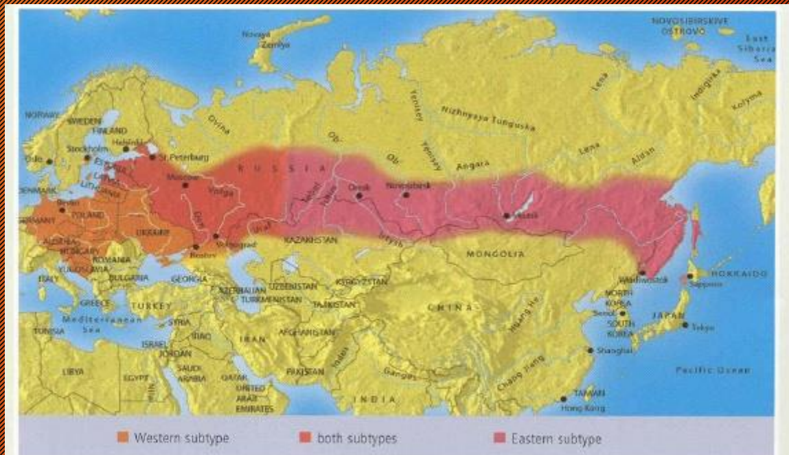
Figure 11: Distribution map of the Western and Eastern subtypes of the TBE virus 80